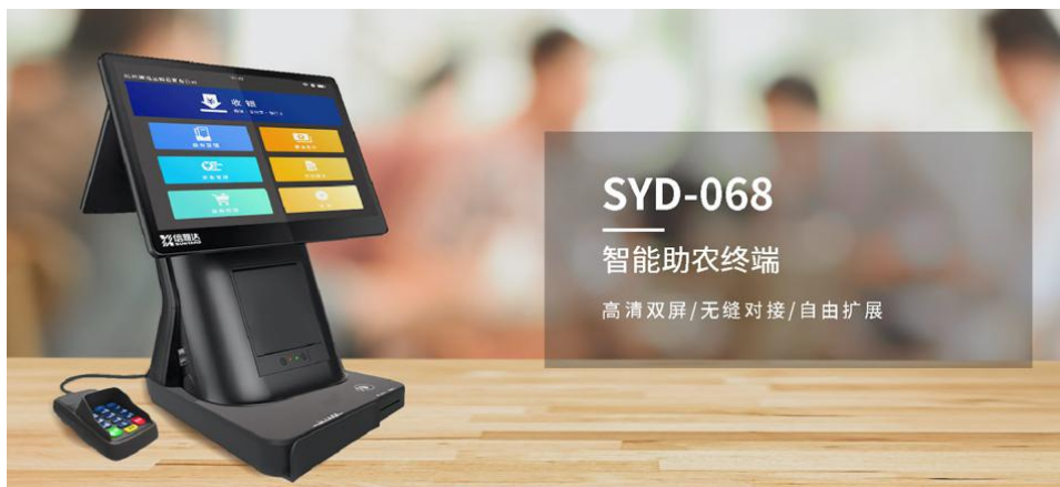
信雅达智能助农终端

智能型助农金融服务终端，摆脱了传统金融自助服务终端的设计框架，创新地将双面屏安卓智能设备与可灵活配置的模块化组件相结合，既可灵活的部署应用于商业零售场景，赋能商户数字化运营，又能兼顾专业的金融业务办理需要，助力商业银行助农金融服务点、代办处、便民金融服务超市等业务转型升级。